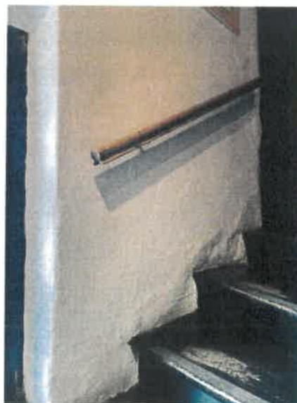
- widok na ścianę szachulcową z poziomu I kondygnacji schodów