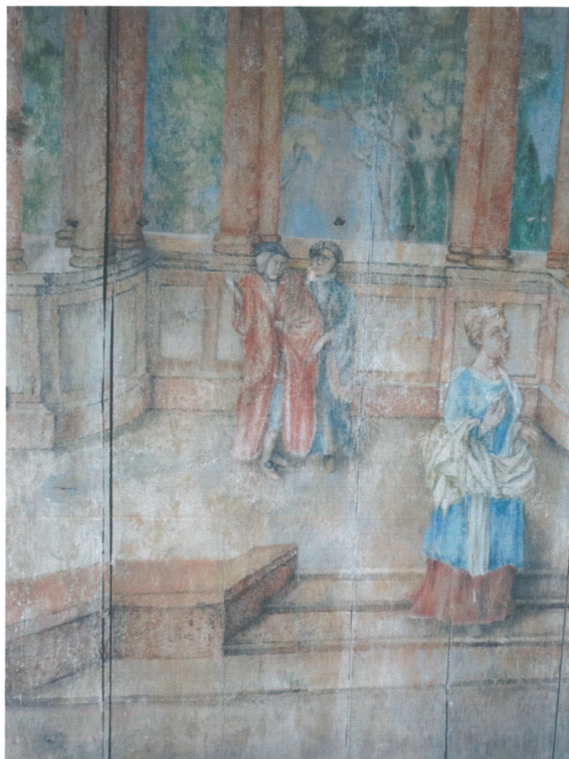
- fragment polichromii ścian ( wnętrze nr 1)

Występująca w przeszłości zarówno wysoka temperatura jak i niska wilgotność powietrza spowodowała częściową degradację gruntów oraz spoiwa warstw malarskich, czego efektem są ławice drobnych złuszczeń na malowidłach. W wielu miejscach widoczne są zmiany kolorystyczne polichromii, zacieki, zaplamienia, zabielenia i silne zabrudzenia.