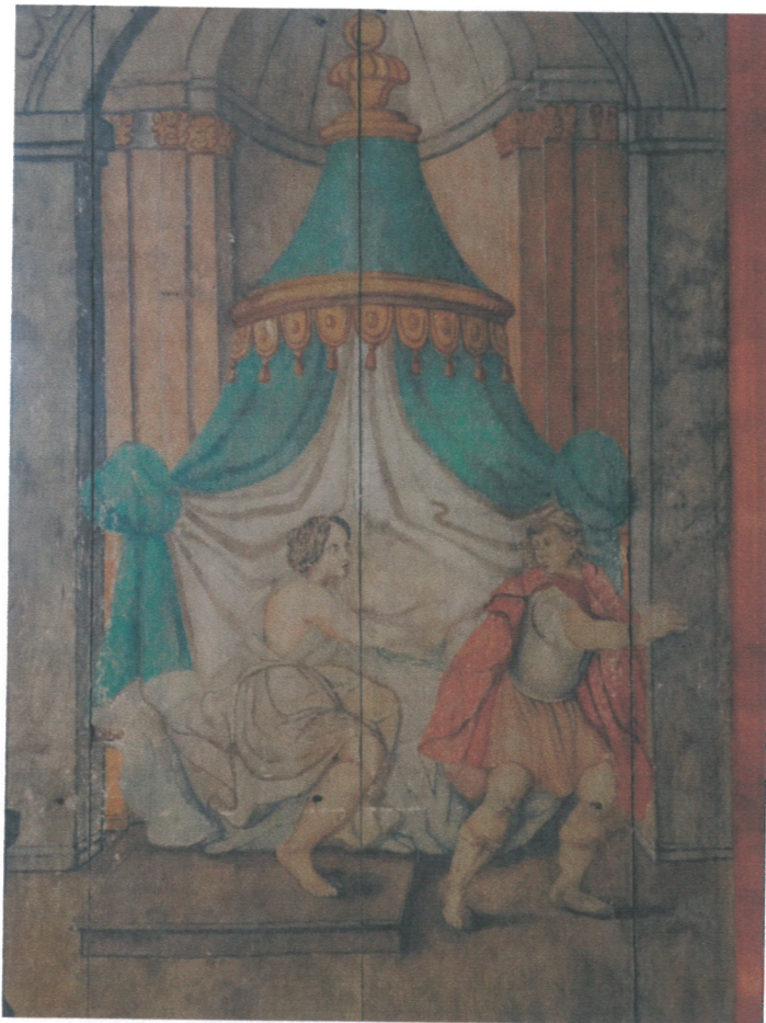
- fragment polichromii ścian - scena " Józef i żona Putyfara"