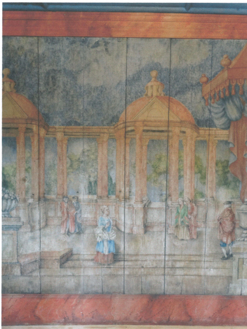
- fragment polichromii ścian (wnętrze nr 1)

Przedmiotem planowanych prac jest przeprowadzenie pełnej konserwacji XVII / XVIII wiecznych polichromii znajdujących się w dwóch pomieszczeniach II kondygnacji Młyna Papierniczego w Dusznikach Zdroju. Malowidła dekorują drewniane ściany oraz drewniane stropy, tworząc wyjątkowy wystrój malarski tych zabytkowych wnętrz.