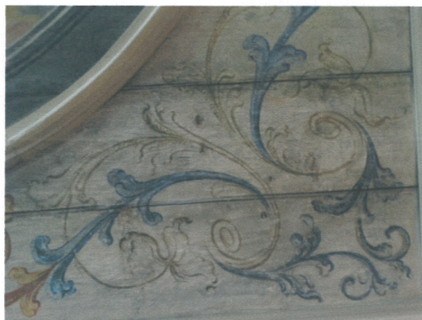
- fragment polichromowanego stropu ( wnętrze nr 1) - fragment polichromowanego stropu ( wnętrze nr 2)