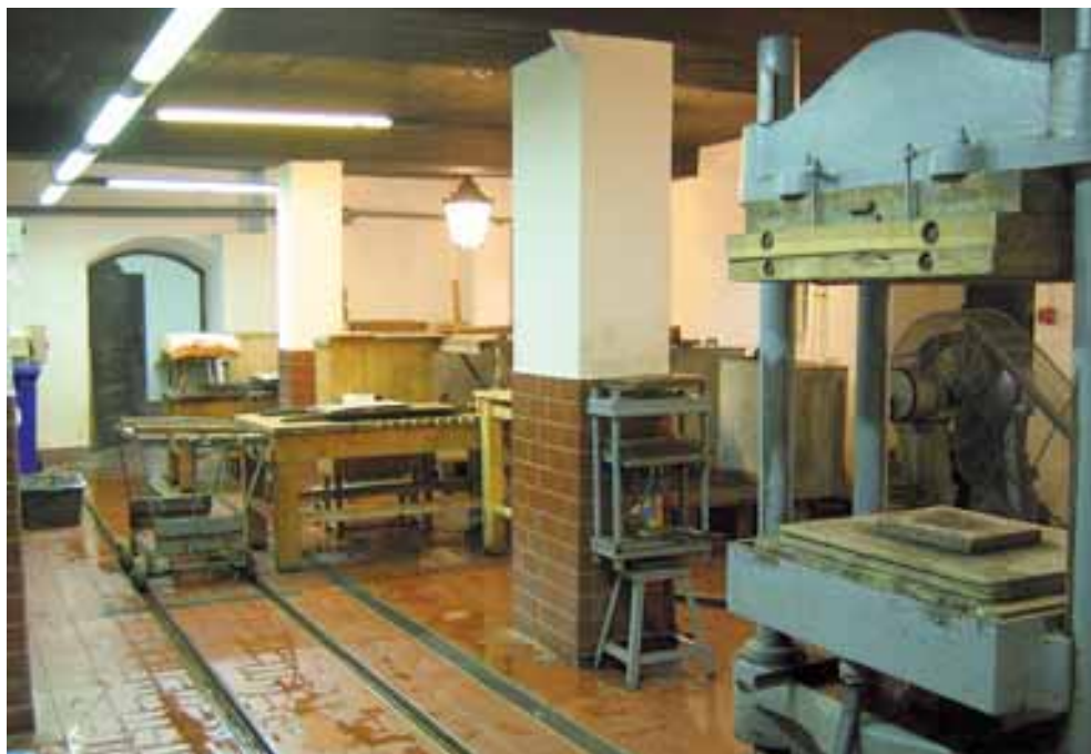
Czerpalnia po usunięciu skutków powodzi