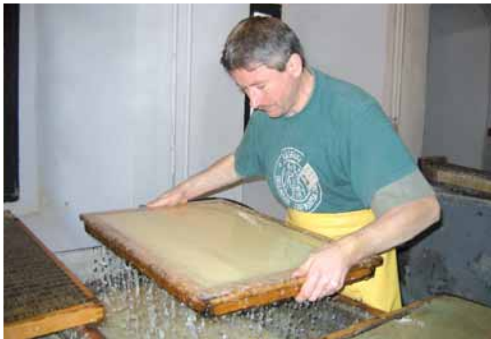
Pokazy czerpania papieru są jedną z największych atrakcji Muzeum