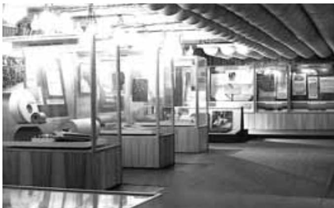
Wystawa przetwórstwa papierniczego