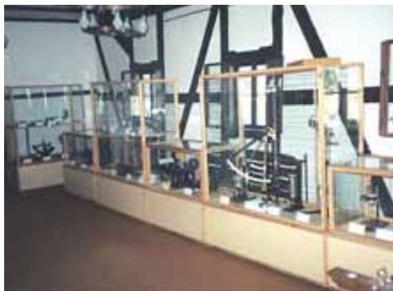
Ekspozycja stała na początku lat 90. XX w. (sala nr 4)