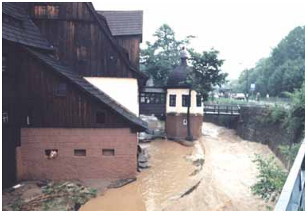
Powódź z 1998 r. – największe nieszczęście Muzeum ostatnich lat