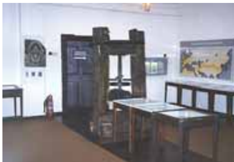
Ekspozycja stała na początku lat 90. XX w. (sala nr 1)