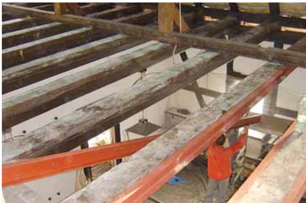
Przebudowa z lat 2007-2008 – wzmacnianie stropów w budynku głównym