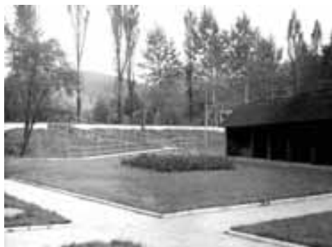
Dziedziniec muzealny z zejściem oraz fragment wiaty na ciężkie eksponaty (z prawej)