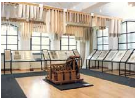
Ekspozycja otwarta w 1997 r. (sala nr 1)