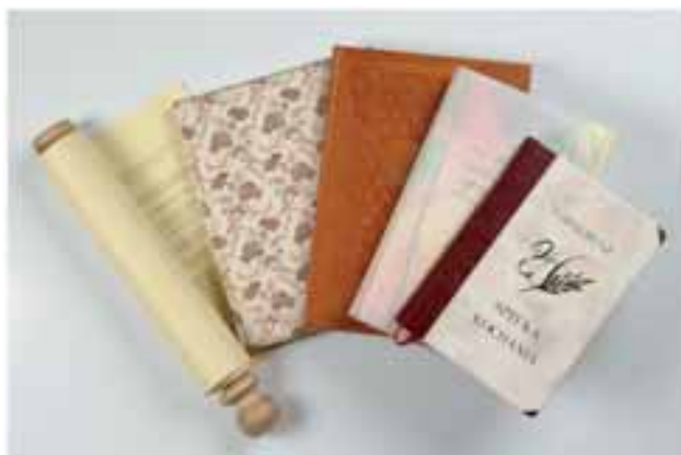
Wydawnictwa bibliofilskie na papierze ręcznie czerpanym w Muzeum Papiernictwa

Ponadto wydzielono w niej zbiory specjalne, które obejmują różnorodnie tematycznie starodruki wydane przed 1800 r. (około 100 sztuk) oraz publikacje bibliofilskie, wydane na papierze ręcznie czerpanym w dusznickim Muzeum (60 egzemplarzy).