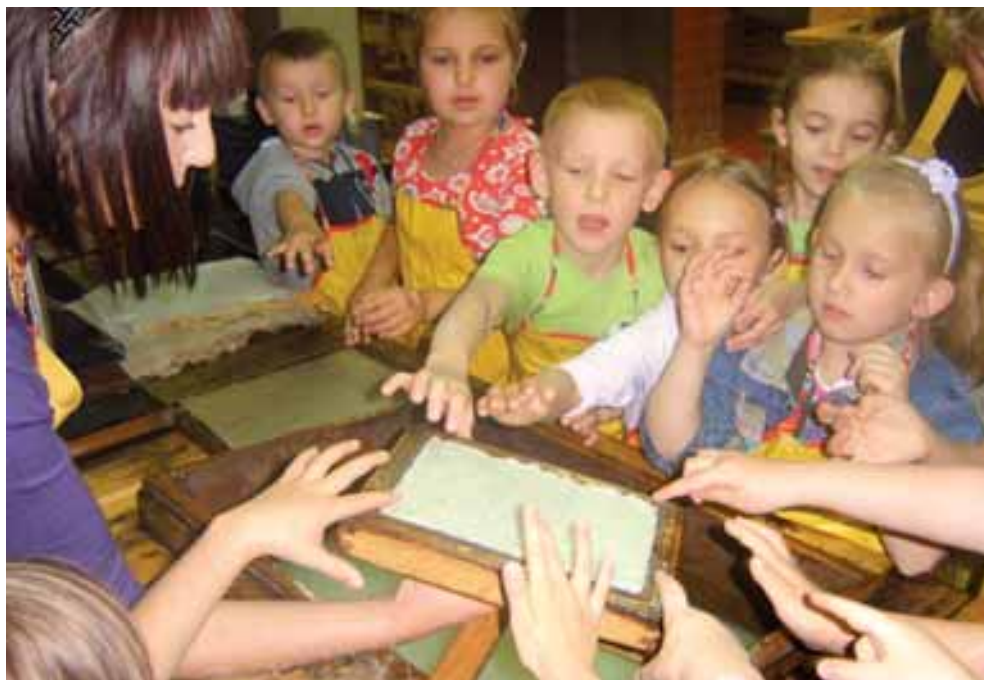
Możliwość wykonania własnej kartki papieru zaliczana jest do głównych atrakcji ziemi kłodzkiej