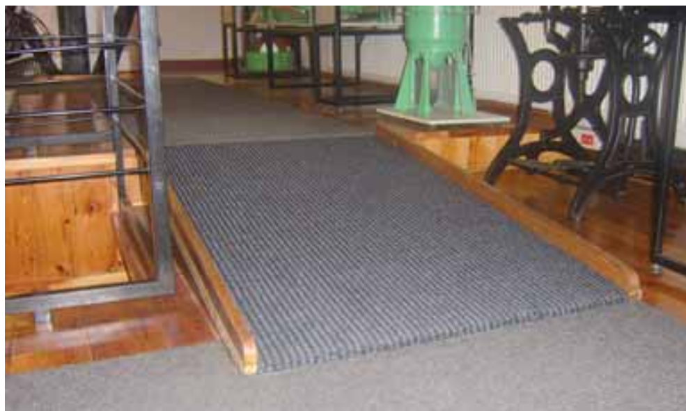
Zainstalowano podjazdy ułatwiające poruszanie się w Muzeum osobom niepełnosprawnym