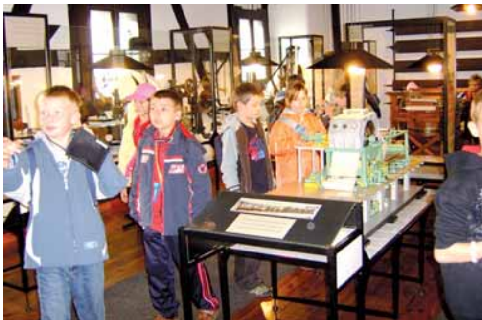
Wystawy wzbogacone licznymi eksponatami wzbudzają zainteresowanie zwiedzających