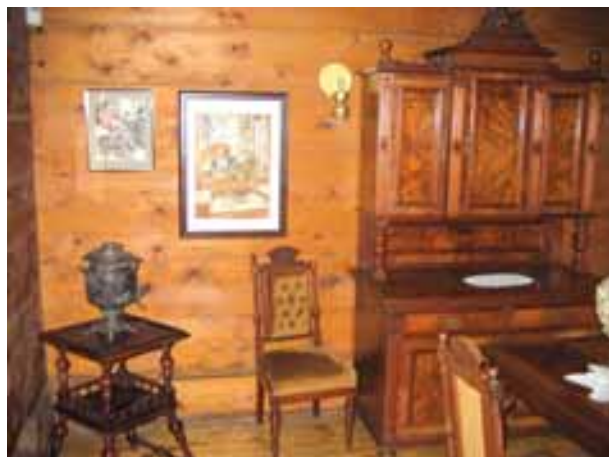
Meble, wytw. niem. ok. 1880