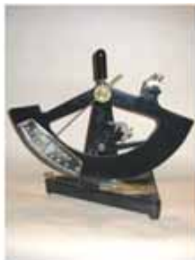
Aparatura laboratoryjna: aparat do oznaczenia przepuklenia papieru ok. 1930 aparat do oznaczenia oporu przedarcia papieru typu Elmendorf 1925

Unikatowy charakter posiadają też matryce do drukowania tapet z początku XX w. (19 sztuk), przekazane w latach 1966–1969 przez Gnaszyńskie Zakłady Wyrobów Papierowych w Gnaszynie k. Częstochowy. Pochodzą one z Częstochowskiej Wytwórni Obić Papierowych, dawniej Gerke i S-ka, założonej w 1894 r., największej wówczas polskiej fabryki tapet, w której do 1914 r. zdobiono tapety metodą rękodzielniczą z zastosowaniem płaskich matryc drzeworytniczych, uzupełnianych zazwyczaj metalowymi elementami. Jednak gros tapet w tym czasie fabryka częstochowska produkowała sposobem maszynowym, stosując mosiężne, stalowe, gumowe i filcowe walce drukarskie.