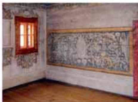
Polichromia XVII – XIX w.