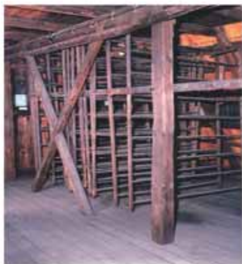
Wieszaki do suszenia papieru XIX/XX w.

W tym miejscu należy wspomnieć o innym zachowanym elemencie wystroju papierni, mianowicie o unikatowych malowidłach z XVII–XIX w., dekorujących stropy i ściany dwóch pomieszczeń na kondygnacji strychowej, pełniących niegdyś funkcje mieszkalne. Niespójną chronologicznie i stylistycznie polichromię, wykonaną farbami klejowymi przez nieznaną twórców, pokryto w latach 30. XX w. warstwami pobiał. Malowidła, przedstawiające motywy roślinne, sceny rodzajowe i alegoryczne, odsłonięto około 1960 r., a w latach 1985–1987 odrestaurowano 3 .