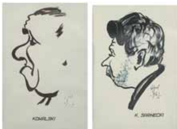
Karykatury papierników polskich, W. Żur 1967, tusz / piórko

Wart odnotowania jest także zbiór ekslibrisów (ponad 200 sztuk) wykonanych w latach 1963–1970 techniką drzeworytu, linorytu i cynkografii przez uznanych (Zygmunt Acedański) i mniej znanych twórców (Czesław Kudła).