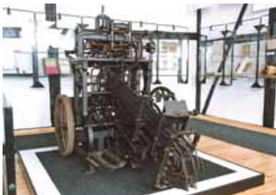
Maszyna do składania kopert tzw. koperciarka, 1930

eguterami służącymi do nanoszenia znaków wodnych w papierach produkowanych maszyną z sitem płaskim 6 . Muzealna kolekcja liczy zaledwie 5 eguterów używanych w końcu XIX i na początku XX w. w Fabryce Papieru w Dąbrowicy. Oprócz maszyn i urządzeń papierniczych zbiór zawiera także maszyny i urządzenia drukarskie oraz introligatorskie wyprodukowane przed 1945 r.