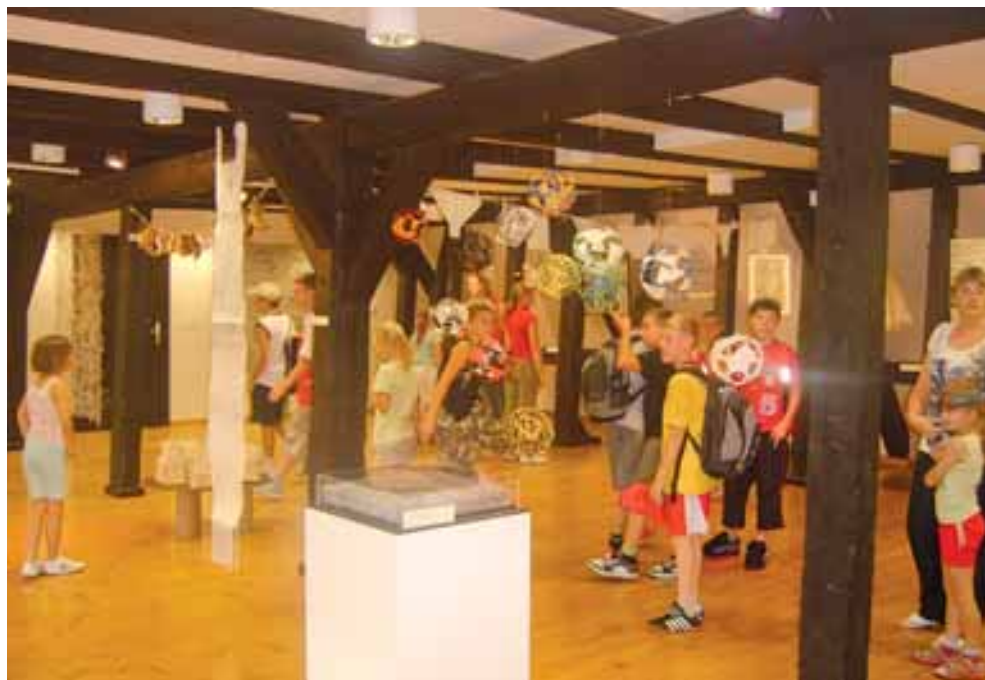
Efektom przebudowy strychu jest nowa sala wystawiennicza