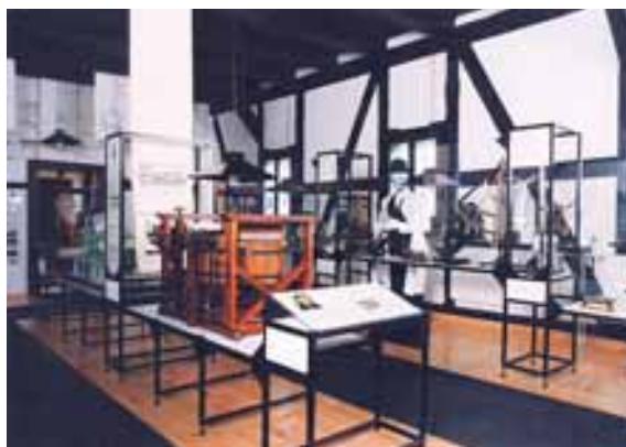
Fot. 5. Wystawa otwarta w 1998 r. (sala nr 4)