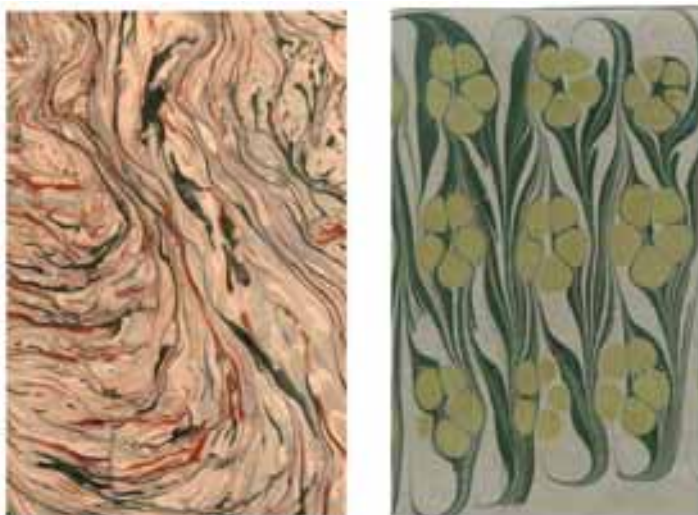
Papiery wzorzyste, S.Szczerbiński, Kraków 1910