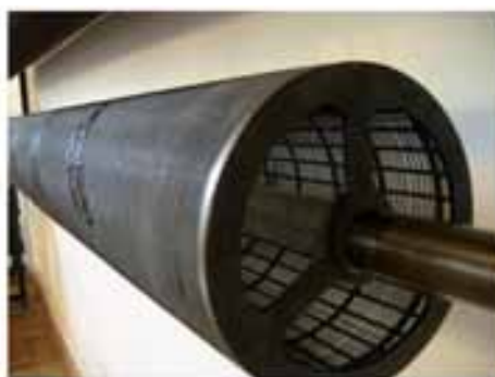
Eguter, Fabryka Papieru w Dąbrowicy, ok. 1932