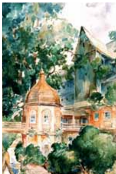
Papiernia dusznicka W. Heyer, ok. 1930 akwarela

Niezwykle cenny dla współczesnych badaczy dusznickiej papierni materiał ikonograficzny pozwala w przybliżeniu odtworzyć nie tylko historyczny wygląd bryły architektonicznej młyna, ale także stan jego wyposażenia produkcyjnego i mieszkalnego, który w chwili przejęcia papierni przez władze polskie w 1945 r. był szczątkowy. Zachowały się jedynie drewniane i metalowe wieszaki z przełomu XIX i XX w., służące do suszenia tektury oraz kilka dziewiętnastowiecznych papierniczych form czerpalnych z sitami żeberkowymi.