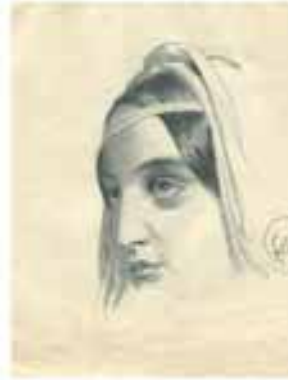
Kolekcja Królikowskich 2 poł. XIX w. – rysunki ołówkiem.