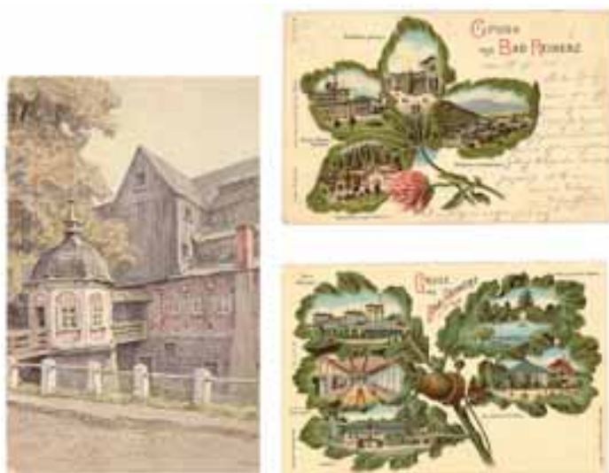
Pocztówki z Dusznik-Zdroju (niem. Bad Reinerz), pocz. XX w.

Zbiory gromadzone od 1999 r. w Dziale Historii Dusznik-Zdroju liczą obecnie około 500 przedmiotów kultury materialnej i duchowej, ilustrujących dorobek miasta i jego mieszkańców. Znalazły się w nich zarówno wyroby konwisarskie (naczynia z cyny), medalierskie, meblarskie, jak i obrazy olejne oraz grafika użytkowa, którą reprezentuje bogata kolekcja wydanych przed 1939 r. pocztówek z Dusznik-Zdroju i okolic.