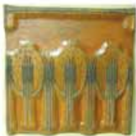
Matryce do drukowania tapet, XIX/XX w. Częstochowska Fab. Obić Papierowych

Unikatowy charakter posiadają też matryce do drukowania tapet z początku XX w. (19 sztuk), przekazane w latach 1966–1969 przez Gnaszyńskie Zakłady Wyrobów Papierowych w Gnaszynie k. Częstochowy. Pochodzą one z Częstochowskiej Wytwórni Obić Papierowych, dawniej Gerke i S-ka, założonej w 1894 r., największej wówczas polskiej fabryki tapet, w której do 1914 r. zdobiono tapety metodą rękodzielniczą z zastosowaniem płaskich matryc drzeworytniczych, uzupełnianych zazwyczaj metalowymi elementami. Jednak gros tapet w tym czasie fabryka częstochowska produkowała sposobem maszynowym, stosując mosiężne, stalowe, gumowe i filcowe walce drukarskie.