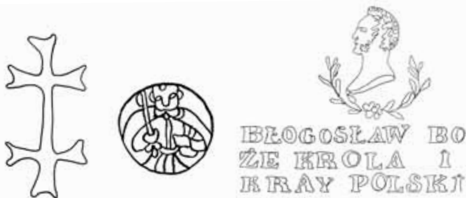
Filigranany papierni: Prądnik Czerwony 1509, Duszniki ok. 1591, Solec 1832

W latach 1992–2008 Muzeum zgromadziło blisko 3000 arkuszy papierów ręcznie czerpanych i maszynowych. W tej liczbie zawiera się obszerna kolekcja papierów czerpalni śląskich z XVII–XIX w., w tym także papierni dusznickiej.