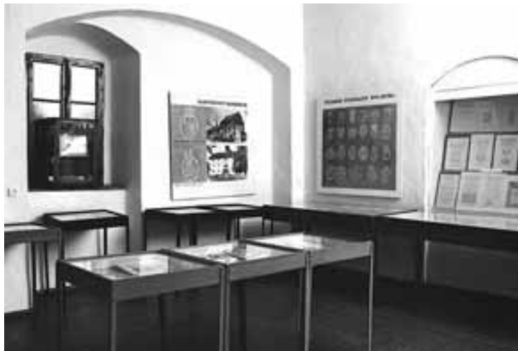
Pierwsza ekspozycja muzealna (sala nr 2)