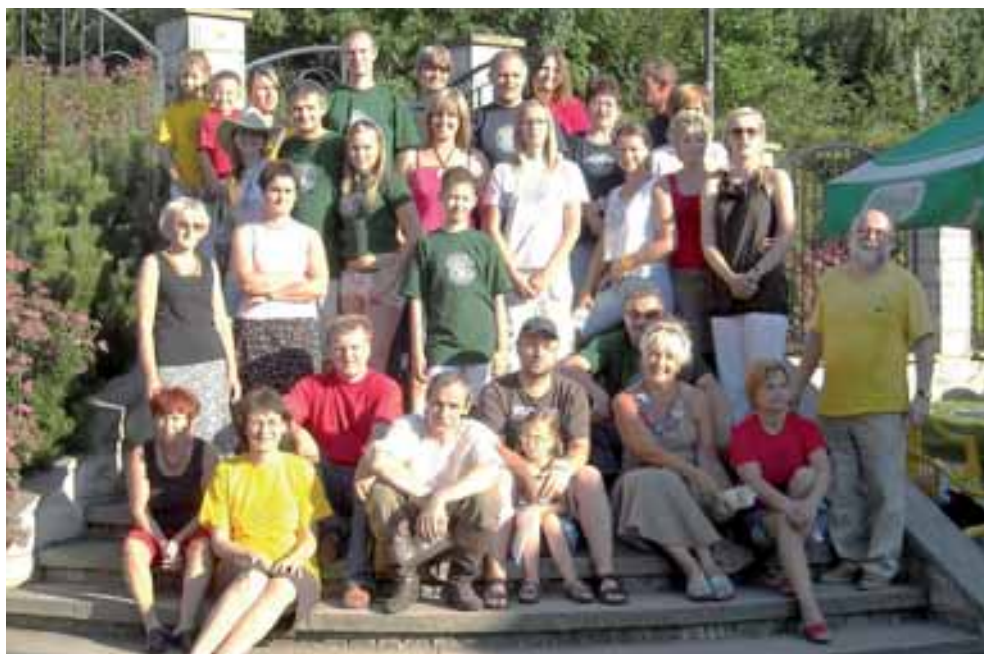
Pracownicy i przyjaciele Muzeum – po zakończeniu Święta Papieru w 2008 r.