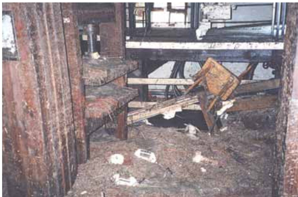
Zniszczenia w czerpalni