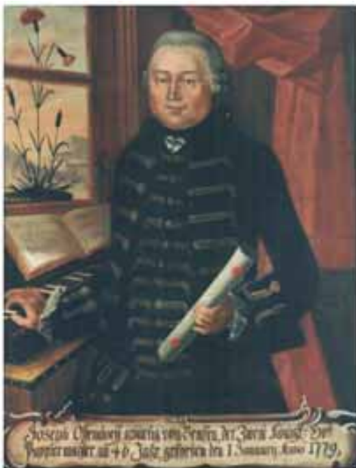
Portret Josepha Ossendorffa (1733–1779)

Zgromadzone muzealia podzielono na historyczne, artystyczne i techniczne. Ta podstawowa klasyfikacja