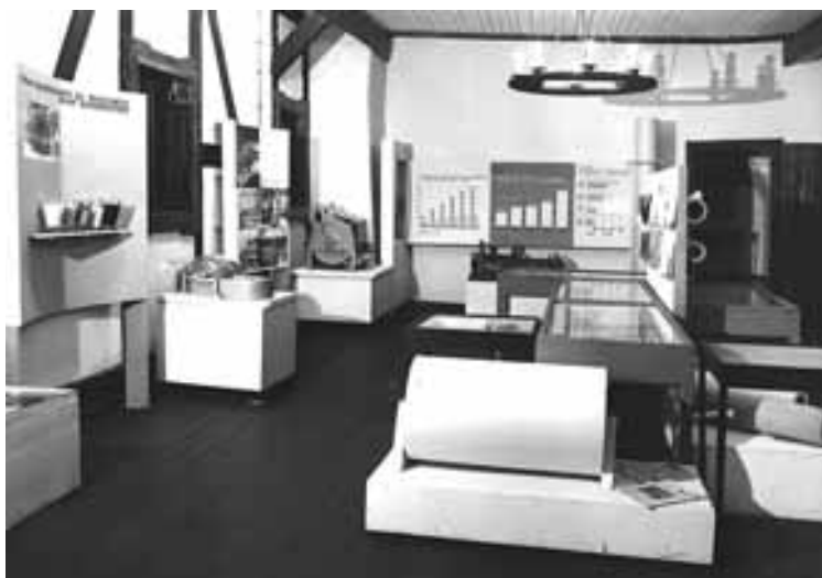
Pierwsza ekspozycja muzealna (sala nr 4)