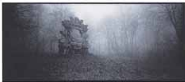
Piotr Chojnacki - Przy okolicy, z cyklu Kontury realności, 2001